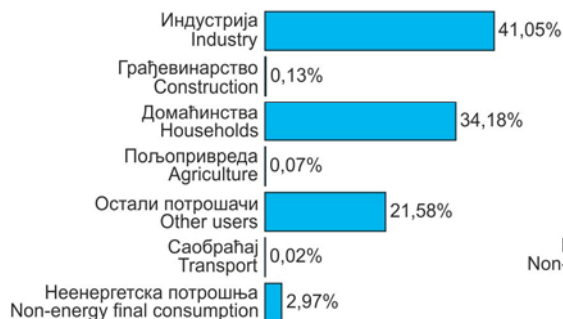
Граф. 10.5. ФИНАЛНА ПОТРОШЊА НАФТЕ И ДЕРИВАТА НАФТЕ