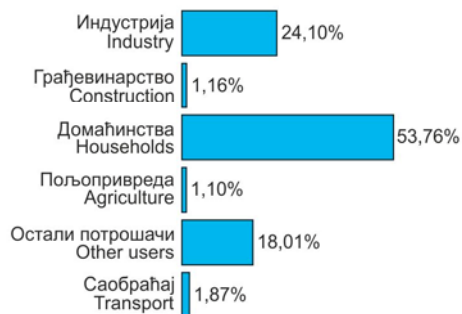
Граф. 10.2. ФИНАЛНА ПОТРОШЊА ЕЛЕКТРИЧНЕ ЕНЕРГИЈЕ FINAL ENERGY CONSUMPTION FOR ELECTRICITY